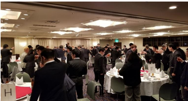
← 新年宴会 →